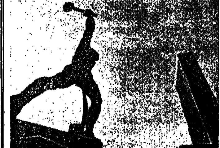
تحتفل السوفييت ال معاريفه لجمال بلخيشا لوتشيشا... هدية الحكومة السوفيتية الى منظمة الامم المتحدة.